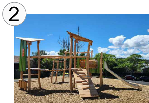
Origin' Groen multifunctionele speelcombinatie