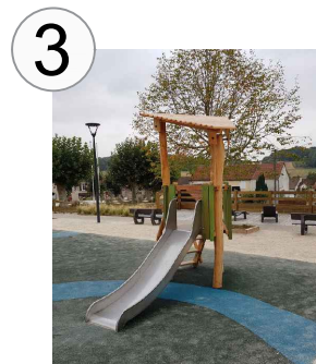
Origin' Groen kleine klimtoren