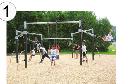
Zeshoekige schommel metaal