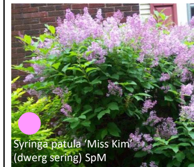
Syringa patula 'Miss Kim' (dwerg sering) SpM