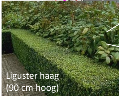
Liguster haag (90 cm hoog)