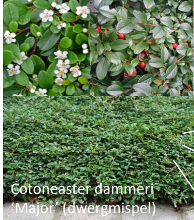
Cotoneaster dammeri 'Major' (dwergmispel)