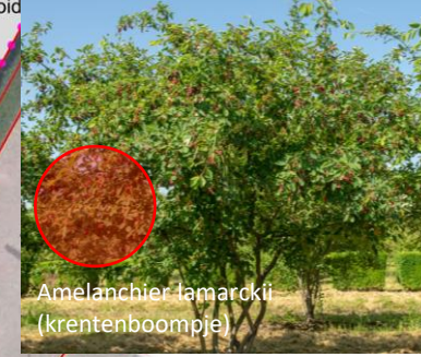
Amelanchier lamarkii (krentenboomple)