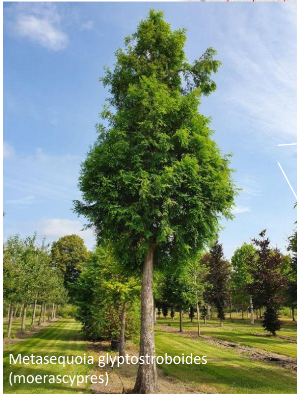
Metasequoia glyptostroboides (moerascypres)