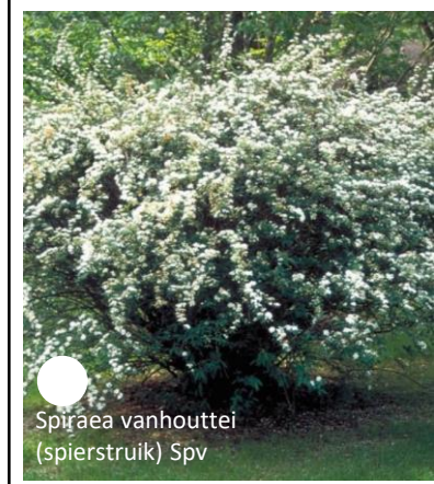
Spiraea vanhouttei (spierstruik) Spv