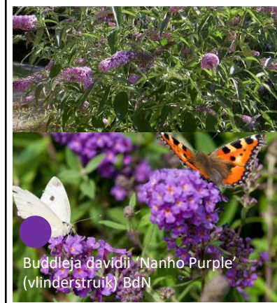
Buddleja davidii 'Nanho Purple' (vlinderstruik) BdN