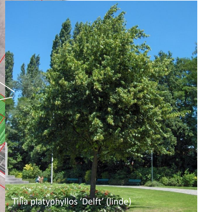
Tilia platyphyllos 'Delft' (linde)