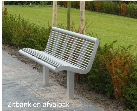
Zitbank en afvalbak