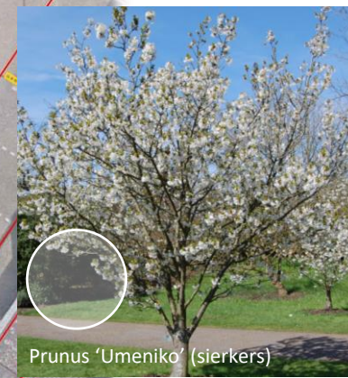
Prunus 'Umeniko' (sierkers)