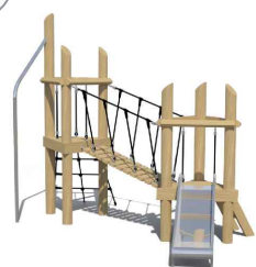
Speeltoren met glijbaan