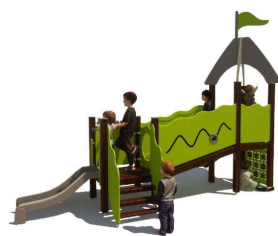
Speeltoren met glijbaan